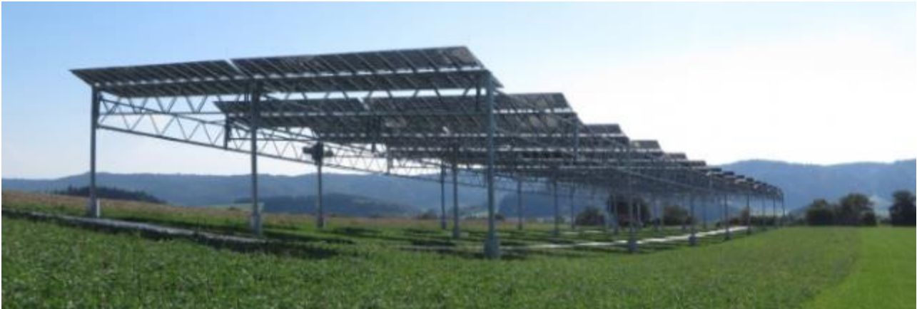
Bild 2 Agrophotovoltaik-Pilotanlage auf dem Gelände der Demeter-Hofgemeinschaft in Heggelbach.

Eine Frage stellt sich da dem neutralen Beobachter: ... es ist wärmer, dunkler und trockener .. Das ist doch all das, was vom Klimawandel als Nachteil berichtet, beziehungsweise simuliert wird. Auf einmal soll das kein Nachteil sein, wenn diesen Effekt der Kampf gegen den Klimawandel selbst erzeugt.